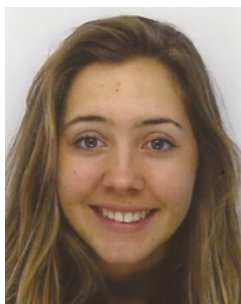
n° 402317 OHRESSER- JOURMARD DANAE