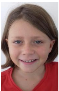
n° 533287 LE TONQUEZE IANEE