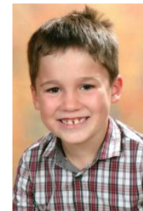
n° 498338 BOURSIN PIERRE